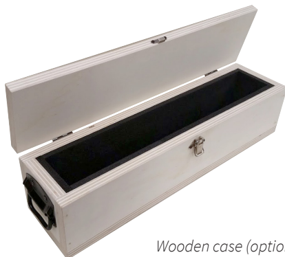
Wooden case (optional)

Fertigung mit 2 ebenen und parallelen geläpften Flächen. Die H-Form gewährleistet Stabilität und Leichtigkeit. Die Lieferung ist in 3 Genauigkeitsgraden möglich, wie in der Tabelle dargestellt: die Toleranz der Parallelität ist gleich der Toleranz der Ebenheit. Geschliffene Seitenflächen ( \pm 20 \mu\text{m/m} ). Auf Wunsch kann das Lineal mit 2 beidseitig angeordneten Handgriffen und Holzkoffer versehen werden. Microplan® Prüfbericht enthalten. Kalibrierzertifikat auf Anfrage*.